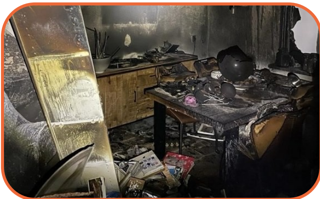
In januari was er brand in één van onze huurwoningen door een bio-ethanolhaard.